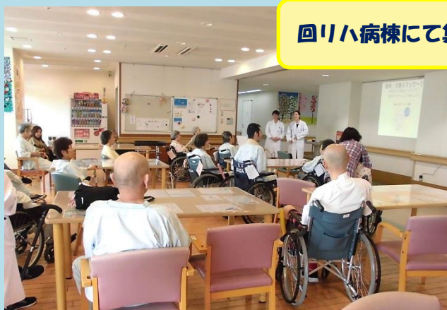
回リハ病棟にて集団教室の実践中

実習生2名も積極的に質問をされたり、熱心に課題にも取り組まれていました(*^□^*) お2人とも大変お疲れ様でした！<m(_)_m>